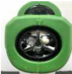
Buse № 1 (Sale)

Pour réduire le risque de blocage, nous recommandons qu'après tous les deux ou trois jours d'utilisation, de pulvériser un réservoir d'eau dans l'unité pour éliminer toute accumulation de produit chimique résiduel qui pourrait s'être produite.