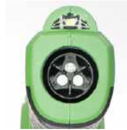
Buse № 2 (Propre)